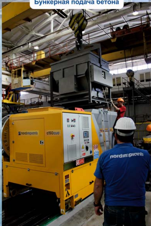
Бункерная подача бетона

После 4х лет успешного производства пустотных плит методом экструзии на технологическом оборудовании Nordimpianti известная украинская компания ПГС «Ковальская» вновь отдала предпочтение своему проверенному партнёру, выбрав компанию Nordimpianti поставщиком второй технологической линии для изготовления преднапряженных пустотных плит перекрытия шириной 1100 мм. и 1500 мм.